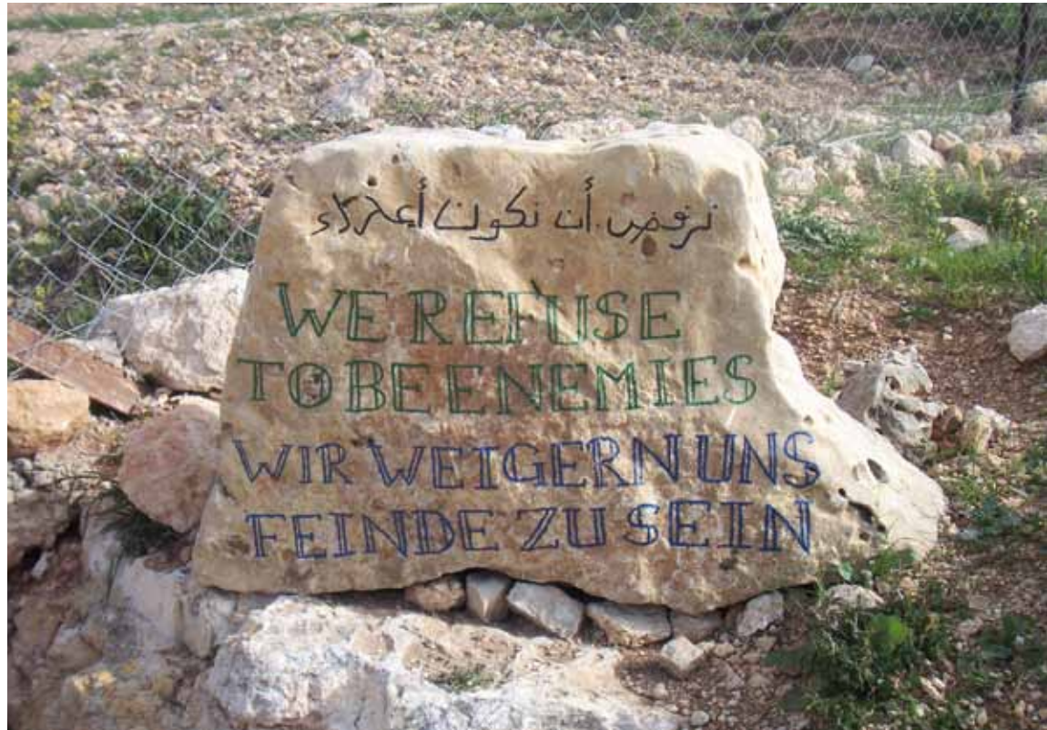
„Wir weigern uns, Feinde zu sein“ – das Bekenntnis zum Frieden der Initiative „Zelt der Völker“, auf Stein geschrieben.

All diese Punkte lassen erahnen, wie schwierig Mission im islamischen Umfeld ist. Eine Brücke zu Menschen muslimischen Glaubens kann in einem ersten Schritt im Sinne der so genannten „Konvivenz“ wohl am besten geschlagen werden. Gemeint ist mit diesem aus der lateinamerikanischen Befreiungstheologie stammenden Begriff Konvivenz die wirkliche Lebens- und Weggemeinschaft mit anderen Menschen: das Sich-kümmern, Interesse für sie zeigen, der Beistand und die Solidarität mit ihnen.