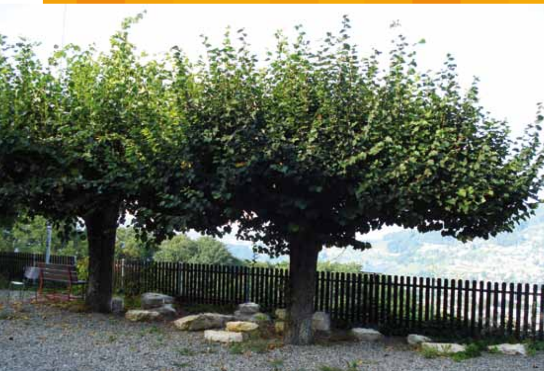
Die „Stolpersteine“ vor dem Aussichtspunkt wollen zum Nachdenken einladen.

ben. So finden Besucher derzeit neun Objekte unterschiedlichster Art und Materialien. Jeder Posten bietet eine Information zum Thema und zum gestalteten Objekt. Folgende Stationen gibt es derzeit zu sehen.