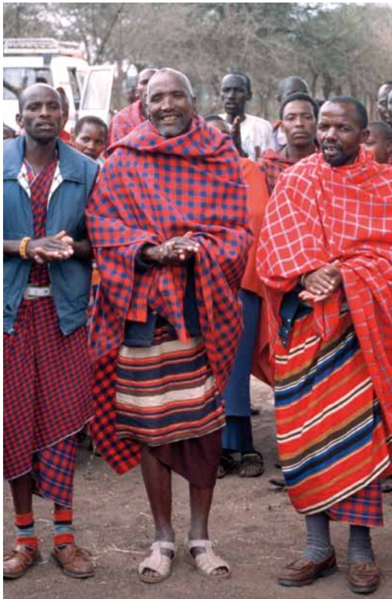
Zu Gast bei einem Muslim (r.). Er hatte die Christen zum Gottesdienst auf seinem Grundstück eingeladen.