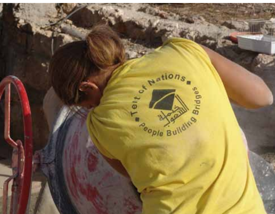
Viele freiwillige Helfer aus allen Teilen der Welt arbeiten für das Projekt „Zelt der Völker“.

Historisch wirkt die Geschichte des westlichen Imperialismus im christlichen Namen (Kreuzzüge, koloniale Unterdrückung, wirtschaftliche Ausbeutung) bis in die Gegenwart nach. Dazu kommt, dass es bei allen religiösen Unterschieden innerhalb des Islams in islamisch geprägten Ländern kein überzeugendes Beispiel für eine klare Trennung von Staat und Religion mit der Möglichkeit von Religionsfreiheit für Andersgläubige gibt. Das Leitbild eines islamischen Gemeinwesens macht jede Hinwendung zum christlichen Glauben zum strafwürdigen „Abfall“ vom Islam. Ein weiteres großes Hindernis für das christliche Zeugnis gegenüber Muslimen ist eine mittlerweile relativ glaubensschwache Christenheit.