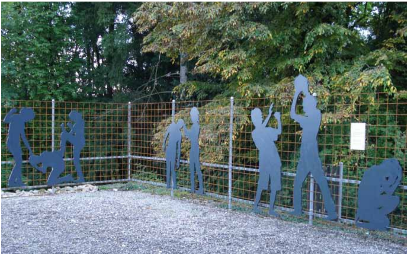
Die Station „Gewalt“ des Friedensweges in Bienenberg wurde von Jugendlichen gestaltet.

Unser Friedensweg nimmt Bezug auf die Heilsgeschichte, und die Stationen mit ihren Objekten sind entsprechend thematisiert. Dahinter steht der Gedanke, dass sich Gottes Grundanliegen mit dem Begriff Schalom auf den Punkt bringen lässt. So entsteht zu den Stichworten Schöpfung – Sünde – Rettung – Hoffnung eine Wechselausstellung. Es gehört zur Grundidee, zu den einzelnen Themen immer wieder auch neue Beiträge durch andere Gruppen und Künstler aufzunehmen. Dabei ist es uns wichtiger, Gruppen und Gemeinden zu einem Beitrag zu aktivieren als höchstes künstlerisches Niveau anzustre-