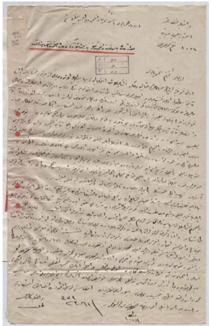
Ein Dokument der Vertreibung: Mit dieser Verfügung ordnete der türkische Innenminister 1915 die Vertreibung armenischer Bürger aus Istanbul an.

Die Entwicklung des Unterrichts in der armenischen Umgangssprache, sowie die Verbreitung moderner protestantischer Gedanken über den Individualismus und die Emanzipation förderten nicht nur die Entwicklung der noch immer kleinen protestantischen Kirche und die materielle Lage der Armenier, sondern fachte vor allem ein armenisches Nationalbewusstsein an, welches sich