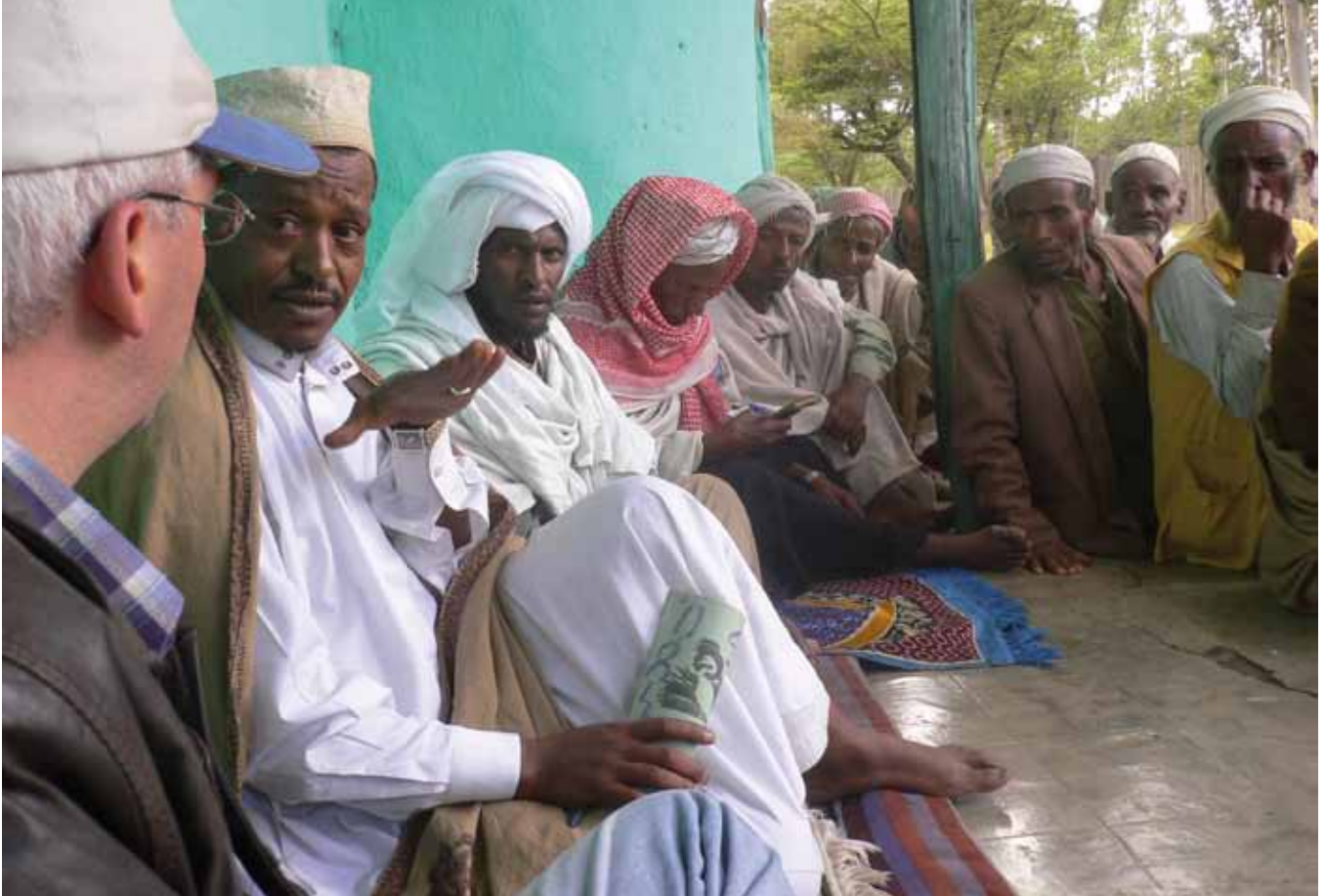
Christlich-muslimisches Dorfgespräch in Äthiopien. Das Hören auf die Anderen kann Konflikte frühzeitig entschärfen.

scheidung gewahrt. Ein bekehrungsorientierter Ansatz macht Muslime zu Objekten, was ein Hindernis beim Aufbau einer Beziehung sein kann. Wenn ausdrücklich der Wunsch geäußert wird, etwas über den Glauben des Anderen zu erfahren, gibt es hilfreiche Anleitungen, wie dieser in verständlicher und nicht-verletzender Weise nahe gebracht werden kann. Hier ist es wichtig zu wissen, was den Anderen verletzt bzw. was er oder sie gerne hört (Respekt dem Koran, Muhammad und anderen Schriften und Traditionen gegenüber). Genuin christliche Liebe lässt sich im Ernstfall nicht hindern, frei von der Liebe Gottes zu den Menschen zu sprechen.