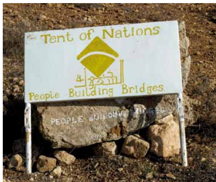
Brücken bauen auf umstrittenem Land will „Zelt der Völker“.

„Zelt der Völker“ hat sich zum langfristigen Ziel gesetzt, Jugendliche darauf vorzubereiten, einen positiven