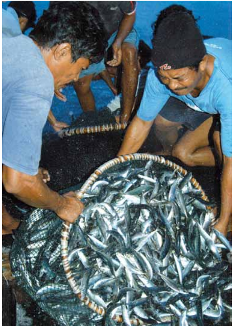
Die gemischt muslimisch-christlichen Fischergruppen haben durch die Zusammenarbeit auch ihre wirtschaftliche Lage verbessert – und Streit wegen der Religion gibt es auch nicht mehr.

Vorbild für das Friedensprojekt ist die Dorfgemeinschaft