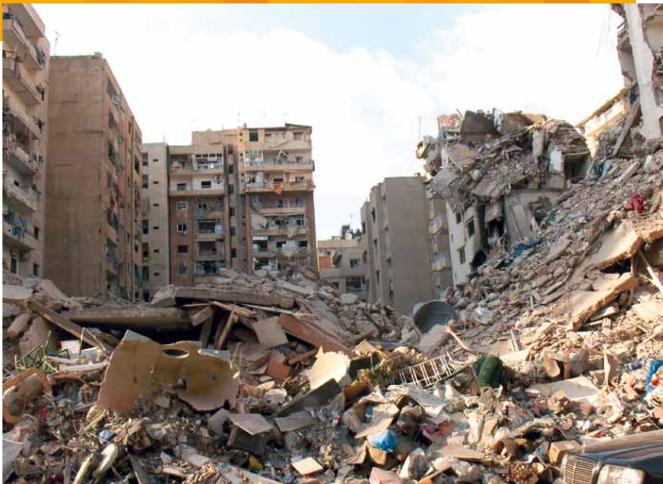
Eine Trümmerwüste hinterließ der „Sommerkrieg“ 2006 in Beirut, den Israel gegen die Hisbollah führte. Die Bomben trafen unterschiedslos Christen und Muslime, die seit Jahrzehnten in einem empfindlichen konfessionellen Gleichgewicht versuchen, den Frieden zu bewahren.

Container zum Tee ein, und seitdem grüßten sie mich fröhlich von den Baugerüsten, während ich schläfrig an meinem Frühstück kaute.