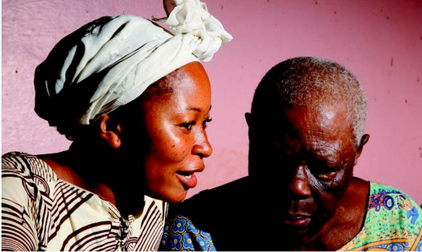
Die heilende Kraft der persönlichen Zuwendung: Krankenschwester (li.) in einem der wenigen Altersheime Kameruns im Gespräch mit einer Bewohnerin.

viduelle Verhalten hat immer Auswirkung auf die Gemeinschaft, es dient oder schadet ihr.