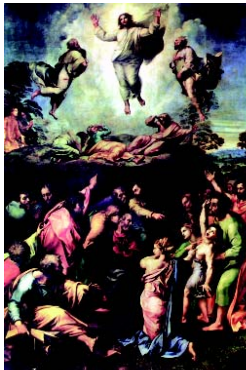
„Die Verklärung Christi“ gehört heute zur Kunstsammlung des Vatikans.

Der Maler stellt die von den Evangelisten als zeitliche Abfolge erzählten Berichte der Verklärung und der Heilung des Knaben gleichzeitig dar und bezieht sie dadurch aufeinander: Das Licht der Herrlichkeit Christi und das irdische Leiden gehören nach dieser Deutung untrennbar zusammen. Über der menschlichen Not ist