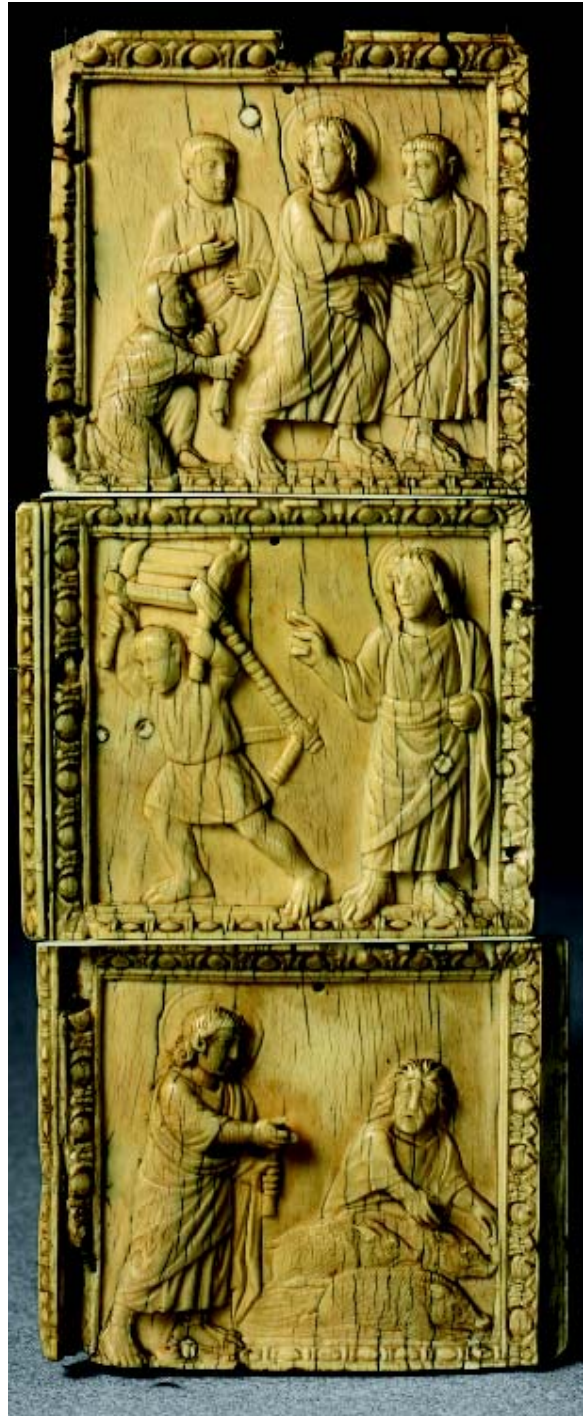
Les Miracles du Christ – Wunder Jesu. Teil eines Diptychons des 5. Jahrhunderts n. Chr. aus dem Louvre, Paris

Der Streit um den wahren Arzt wurde in der jungen Christenheit vehement geführt und schließlich im 2./3. Jahrhundert zugunsten Christi als des einen und wahren göttlichen Arztes entschieden. Das junge Christentum erschien als eine „Religion der Heilung“ 9 : Äußerlich zeigte sich dies dadurch, dass an der Stelle