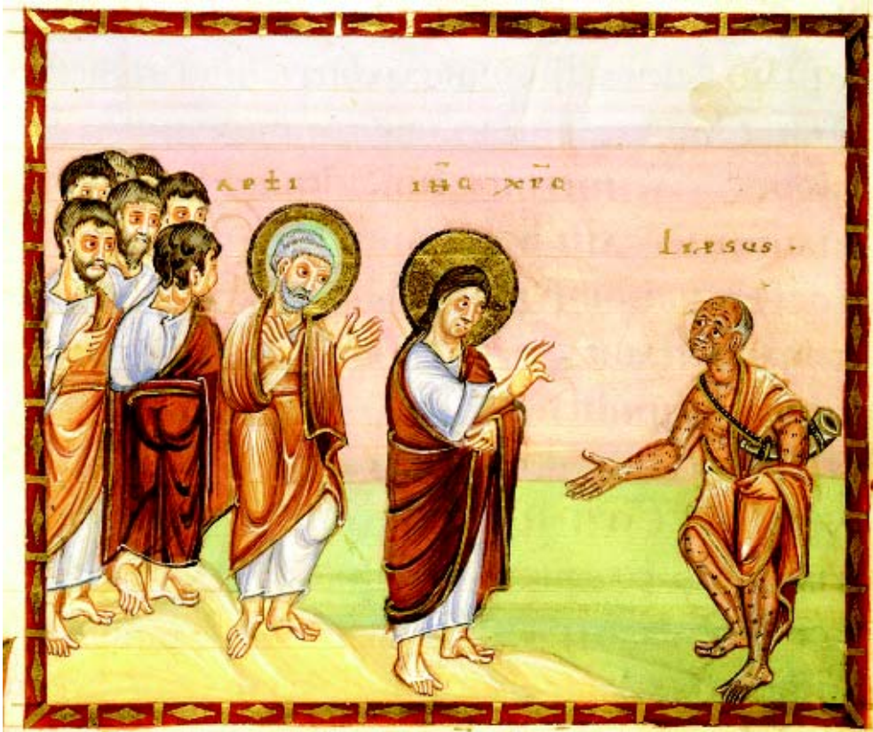
„Die Heilung des Aussätzigen“ aus dem Codex Egberti. Das Evangeliar wurde Ende des 10. Jahrhunderts für den Trierer Erzbischof Egbert hergestellt. Dieser älteste erhaltene neutestamentliche Bildzyklus mit Darstellungen aus dem Leben Christi gehört zum Weltkulturerbe und befindet sich im Stadtarchiv Trier.

biblischen Text von der Heilung des Aussätzigen in unseren Kontext übersetzen und Stellung beziehen.