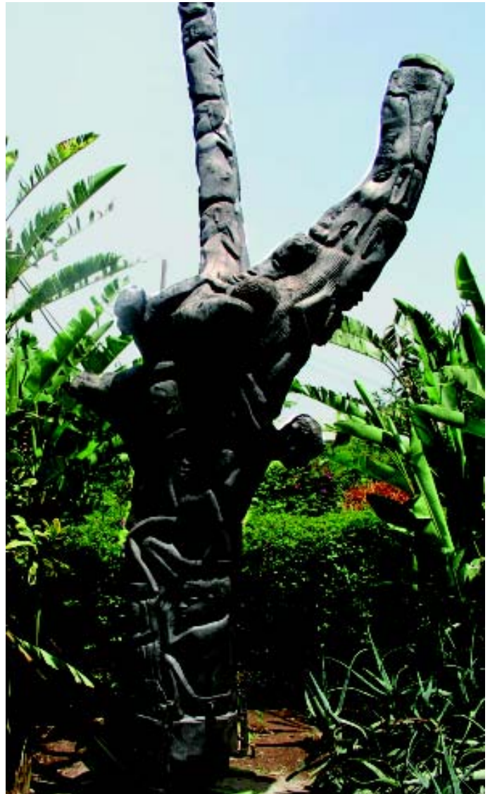
Schnitzkunst aus Ostafrika: „Lebensbaum“ oder „Beziehungsbaum“. Ein Symbol für die Bedeutung des Lebens in Gemeinschaft. (Albert Petersen, Difäm)

Mtu ni Watu – Mensch ist Menschen: Dieses Sprichwort der Swahili-Sprache (Ostafrika) kann nur schwer übersetzt werden und wird auch wiedergegeben mit Ein Mensch ist ein Volk. In Südafrika lautet ein Sprichwort: Ich bin, weil du bist, und in Kamerun wird die Erfahrung weitergegeben, dass menschliche Zuwendung oft so viel wirkt wie ein Medikament: Der Mensch ist die Medizin des Menschen.