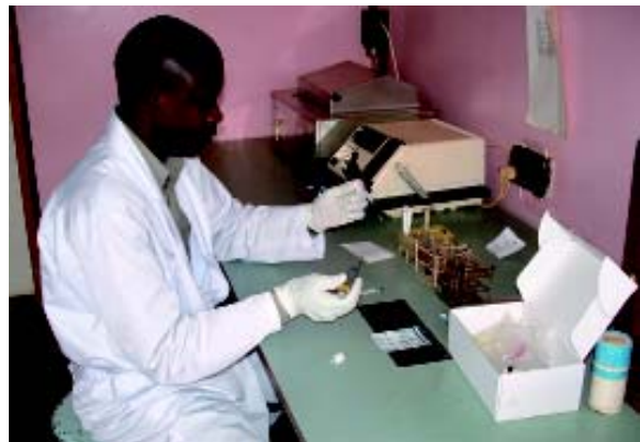
Nur im Labor kann festgestellt werden, ob die Medikamente nicht gefälscht sind. (Difäm)

Ndala und ihre Mutter können das Medikament kaufen, da es seit kurzem möglich ist, günstige Arzneimittel in guter Qualität zu besorgen. Früher waren die Medikamente sehr teuer und manchmal von schlechter Qualität. Heute gibt es die Möglichkeit, die Medikamente überprüfen zu lassen. Sie werden nach Kenia in ein Labor geschickt und dort getestet.