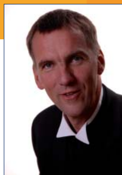
Bischof Jan Janssen Vorstandsvorsitzender des Evangelischen Missionswerkes in Deutschland