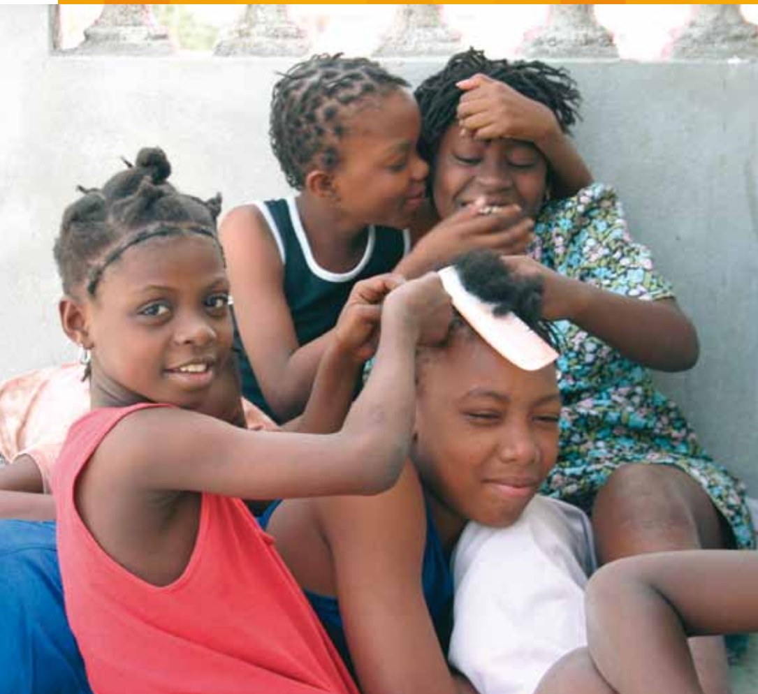
Endlich in Sicherheit: Restavèk-Kinder im Schutzhaus der „Petits Frères de Sainte-Thérèse“, einer katholischen Ordensgemeinschaft. (Jürgen Schübelin)

ze in die Dominikanische Republik geschafft und dort als Hausklaven und Arbeitskräfte in der Landwirtschaft verkauft werden.