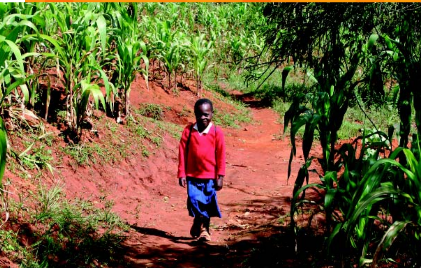
Happy auf dem Schulweg.