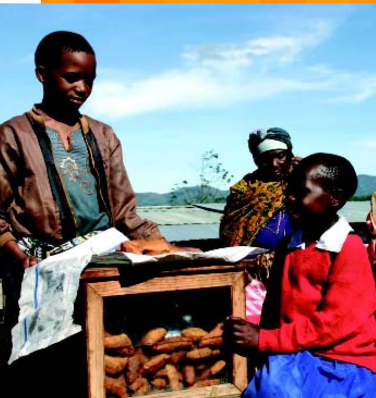
Happy mag Mandazis.

Auf dem Markt bekommst du alles, was du brauchst. Mein liebster Stand ist der Mandazistand. Mandazis werden aus Hefeteig gemacht und dann im heißen Fett direkt auf dem Feuer gebacken. Ich habe gehört bei euch gibt es so was ähnliches, das soll Krapfen heißen, aber ich kann mir nicht vorstellen, dass die genauso gut wie unsere Mandazis schmecken. Die Mandazis sind oft noch ganz frisch. Dann sind sie am besten.